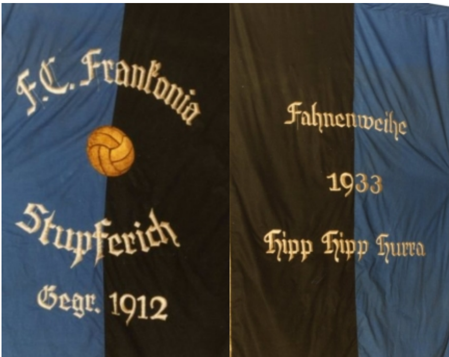
Vorder- und Rückseite der ersten Fahne von 1933

Am Tag danach fand nach dem sonntäglichen Gottesdienst ein Festzug mit Beteiligung der örtlichen Vereine und der eingeladenen Gastvereine Germ. Brötzingen, Busenbach, Durlach-Aue, Spinnerei Ettlingen, Grötzingen, Grünwettersbach, Reichenbach und Spessart zum Festplatz statt, welcher sich auf den Wiesen hinter dem Friedhof befand.