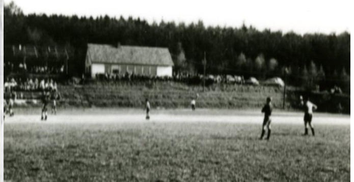
Erster Plan vom Juni 1950