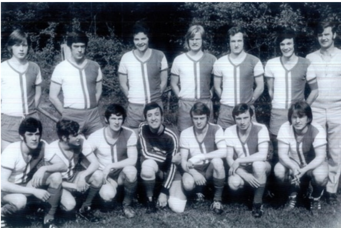
Staffel- und Kreismeister Saison 1971/1972

Die Frankonia sicherte sich mit Siegen gegen den FC Eggenstein und die FT Forchheim auch die Kreismeisterschaft.