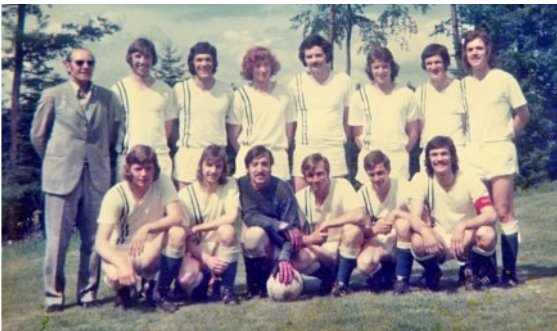
1. Mannschaft 1972/73

Nach Rundenende wurde durch großzügige Unterstützung der Firma Weiler und den Einsatz vieler ehrenamtlicher Helfer die Böschung zur Erstellung eines Stützmauers abgetragen und Stadionstufen versetzt. Auch dem alten Sportplatz wollte man „etwas Gutes tun“. In Eigenarbeit wurden schlechte Spielflächen abgegraben, Mutterboden aufgebracht und Fertigrasen verlegt. „Das erste Schlechtwetter-Spiel“ führte gleich dazu, dass man sich diese Kosten hätte sparen können. Die Frankonia spielte in der Saison 72/73 als Aufsteiger unter Trainer Heini Schön eine beeindruckende Runde. Im Spitzenspiel verlor man vor über 2000 Zuschauern gegen den späteren Meister GU Pforzheim und wurde am Ende Dritter.