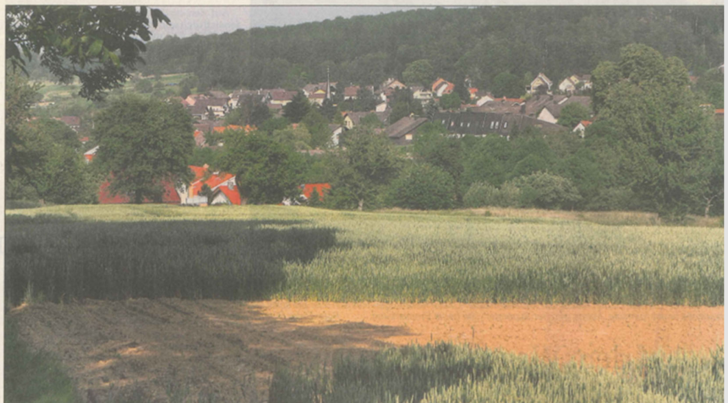
DORFIDYLL IM GRÜNEN: Ganz im Osten von Karlsruhe erfreut sich Stupferich seiner Lage – viel Natur und doch noch recht nahe der Stadt, nur der Verkehrslärm ist ein Manko. Da wollen die einen gerade deshalb weiterbauen, und die anderen warnen gerade deshalb entschieden davor.

Die Gegner sehen in diesem Sporn auch einen das Alibi für die Ortspolitik, den Ruf nach „Arrondierung“ und damit das nächste Neubaugebiet zu Lasten der Natur bald neu anzulegen.