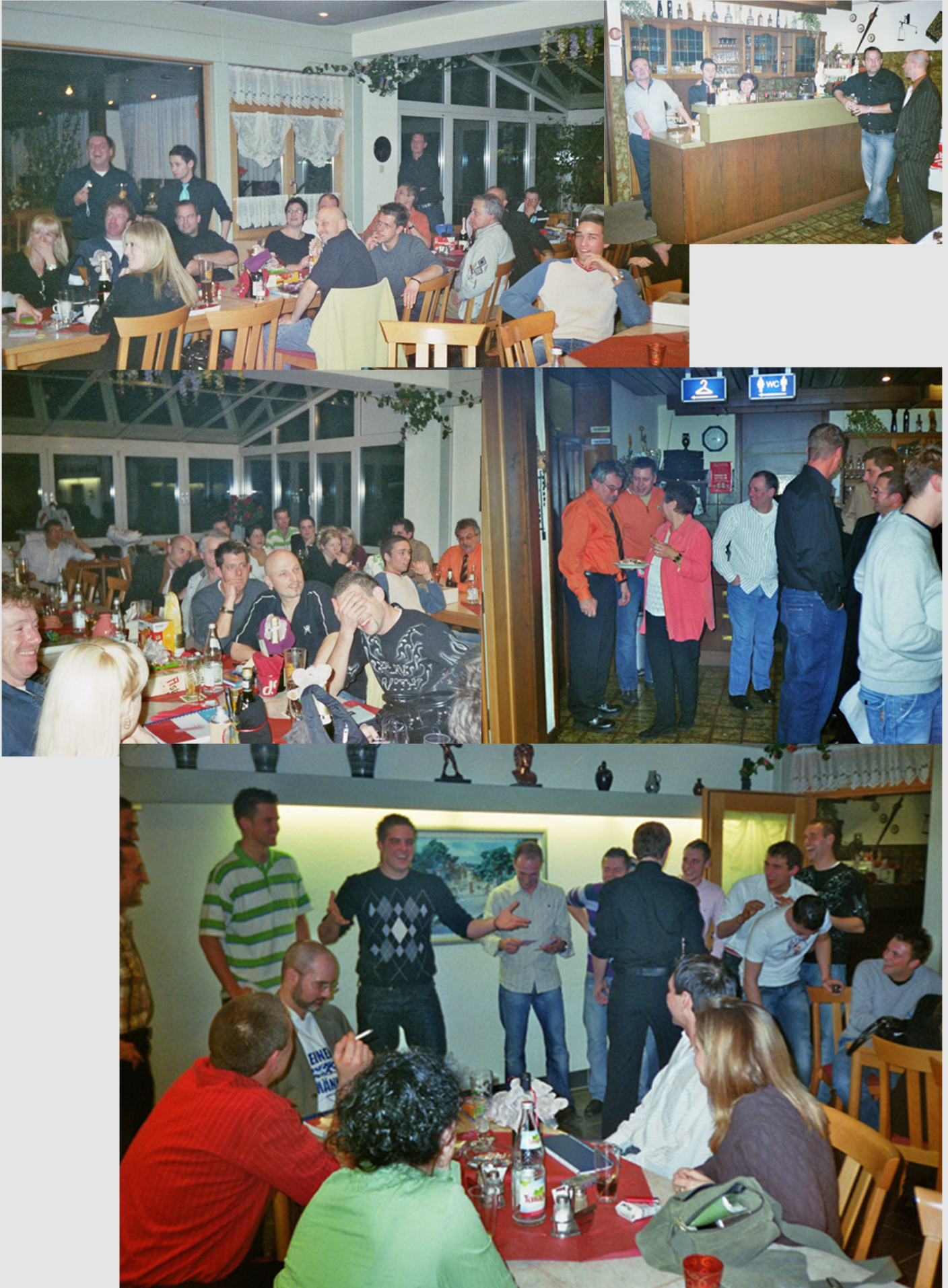
Foto-Impressionen zur Weihnachtsfeier Abteilung Fußball 2006