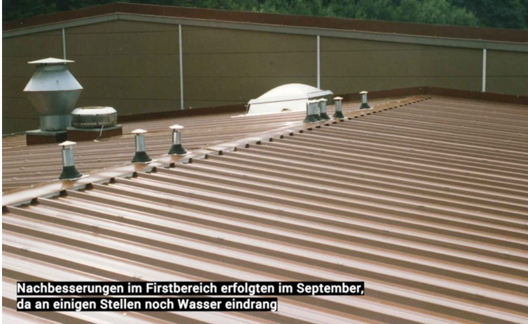
Nachbesserungen im Firstbereich erfolgten im September, da an einigen Stellen noch Wasser eindrang